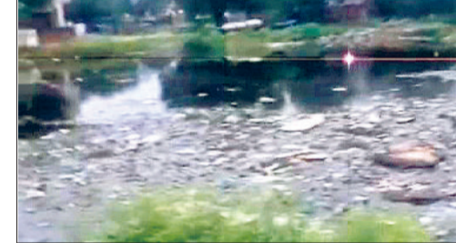
सोनीपत। धाम के पास इकट्ठा हुआ गंदा पानी।

सोनीपत। बैयापुर स्थित दादा मोहनदास धाम के पास गंदे पानी और सड़ते कचरे की समस्या ने स्थानीय लोगों का जीना मुश्किल कर दिया है। धाम के सेवकों ने बताया कि परिसर में लंबे समय से गंदा पानी जमा हो रहा है और बबू देवे वाला कचरा सड़ने से स्थिति और गंभीर हो गई है। कई बार व्यक्तिगत स्तर पर अधिकारियों और जनप्रतिनिधियों को इसकी जानकारी दी गई, लेकिन अब तक कोई समाधान नहीं हुआ। सेवकों ने बताया कि इस स्थिति से धाम में आने वाले श्रद्धालु ही नहीं, बल्कि आस-पास के निवासियों को परेशान कर रहे हैं। बबू देव और गंदगी के कारण क्षेत्र में मच्छरों का प्रकोप बढ़ गया है, जिससे डेंगू, मलेरिया जैसी बीमारियों का खतरा मंडरा रहा है। स्थानीय लोगों और सेवकों ने ग्रामपंचायत से मांग की कि धाम की स्वच्छता व्यवस्था सुधारी जाए और गंदे पानी को निकालने के लिए स्थायी समाधान किया जाए। उन्होंने चेतावनी दी कि यदि जल्द समाधान नहीं हुआ तो ग्रामीणों को आंदोलन का रास्ता अपनाना पड़ेगा।