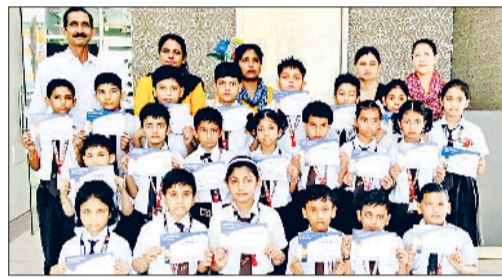
प्रतियोगिता में विजेता घोषित विद्यार्थी अपने गुरुजनों के साथ।

गन्जौर। ब्यू बसंत विहार कालोनी के लोगों ने जनस्वास्थ्य विभाग की अनेकवी और लगातार शिकायतों के बावजूद नहीं मिला समाधान, लोगों में गहरी राग है। स्थानीय लोगों ने बताया कि गली के कई हिस्सों में सौर लाइन जगह-जगह से लौक हो चुकी है, जिससे मकानों की नींव कमजोर हो रही है। अग्री नगरपालिका द्वारा गली का निर्माण किया जाएगा, गली उखड़ी हुई है। यदि गली बनने से पहले सीवर लाइन व्यवस्था दुरुस्त हो जाए तो सरकारी पैसे बर्बाद नहीं होंगे, इसी के चलते उन्होंने गली निर्माण का काम अग्री रुकवा रखा है। इसके लिए जनस्वास्थ्य विभाग कार्यालय में कई बार शिकायतें की गईं, लेकिन हर बार सिर्फ खासपुर्त कर मांगला टाला जा रहा है। हर बार जनस्वास्थ्य विभाग के कर्मचारियों कुछ जगहों पर लीक टैंक कर लौट जाते हैं, जिससे फिर बार-बार लीकेंज हो जाती हैं। जब अधिकारियों से यह सिरे से लाइन बिछाने की मांग की जाती है तो अधिकारी विभाग के पास रुकपते न होने का रोना रोते हैं। स्थानीय निवासियों ने बताया कि अब वे सरकारी तंत्र से उम्मीद छोड़ चुके हैं।