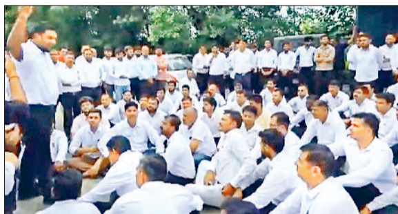
गोहाना। धरने पर बैठे अधिवक्ता पुलिस के खिलाफ प्रदर्शन करते हुए।

वकीलों ने लगाया थाने ले जाकर मारपीट का आरोप पुलिस कर्मियों पर केस दर्ज नहीं होने पर आंदोलन की चेतावनी