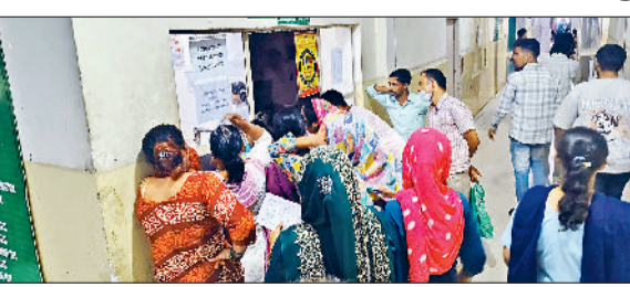
सोनीपत। लैब के बाहर टेस्ट करवाने वालों की भीड़ व रजिस्ट्रेशन काउंटर के बाहर लाइन में पर्वी के लिए खड़े मरीज।

जिला नागरिक अस्पताल में पिछले दस दिनों से खून की जांच की व्यवस्था टप पड़ी हुई है। केमिकल रिजेंट खत्म हो जाने के कारण लीवर फंक्शन टेस्ट (एलएफटी) और किडनी फंक्शन टेस्ट (केएफटी) जैसे जरूरी टेस्ट नहीं हो पा रहे हैं। इससे इलाज के लिए अस्पताल पहुंचने वाले मरीजों को भारी परेशानी का सामना करना पड़ रहा है। मरीजों को मजबूरन निजी लैब में जाने पर मजबूर होना पड़ा रहा है। प्रबंधन की तरफ से जल्द से जल्द सामान मंगवाने की बात कही जा