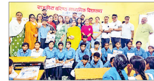
लार्यंस वलब गन्जौर गौरव के पदाधिकारी छात्रों को ड्रेस वितरित करते।